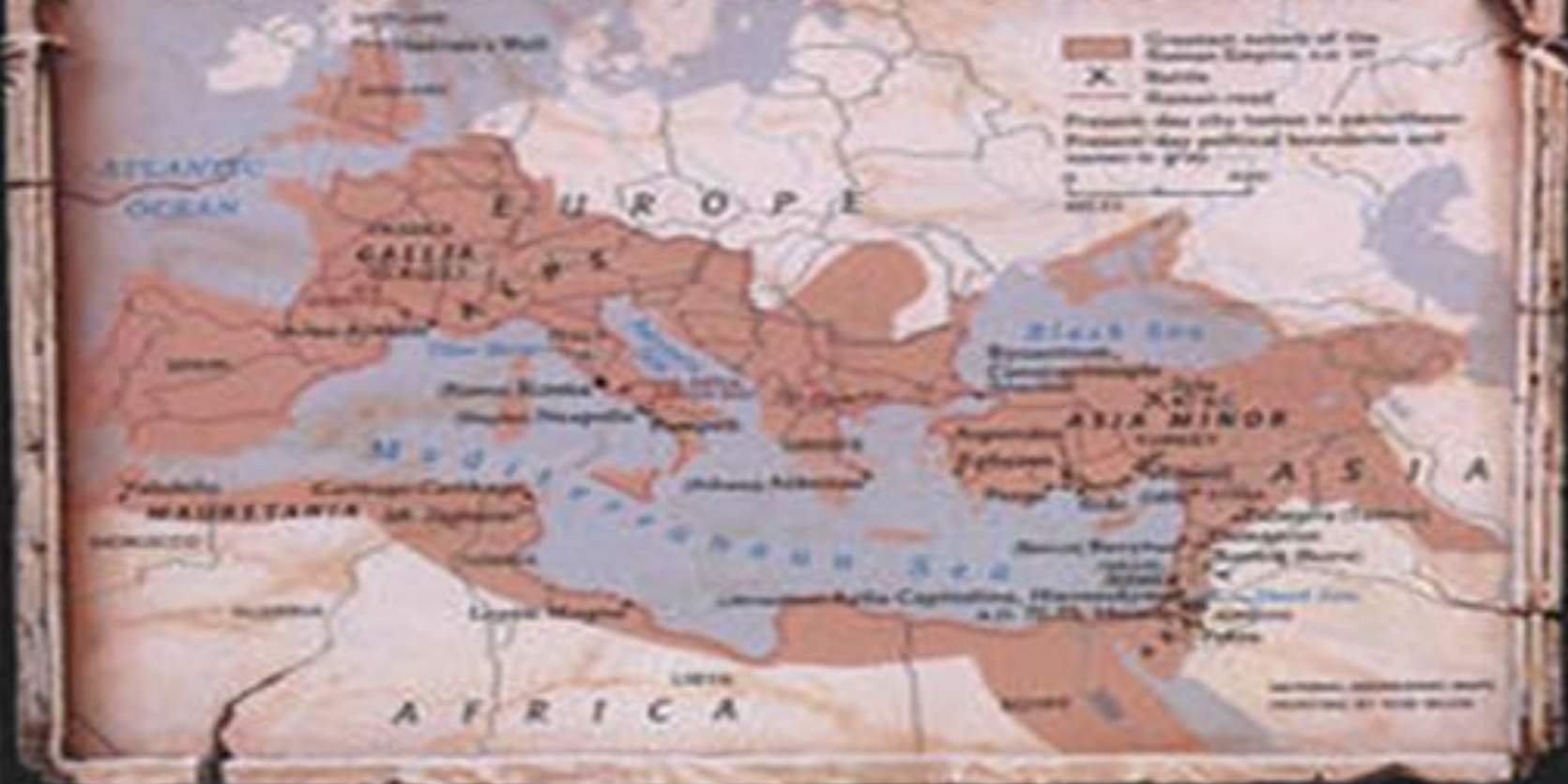
PAX ROMANA 羅馬和諧