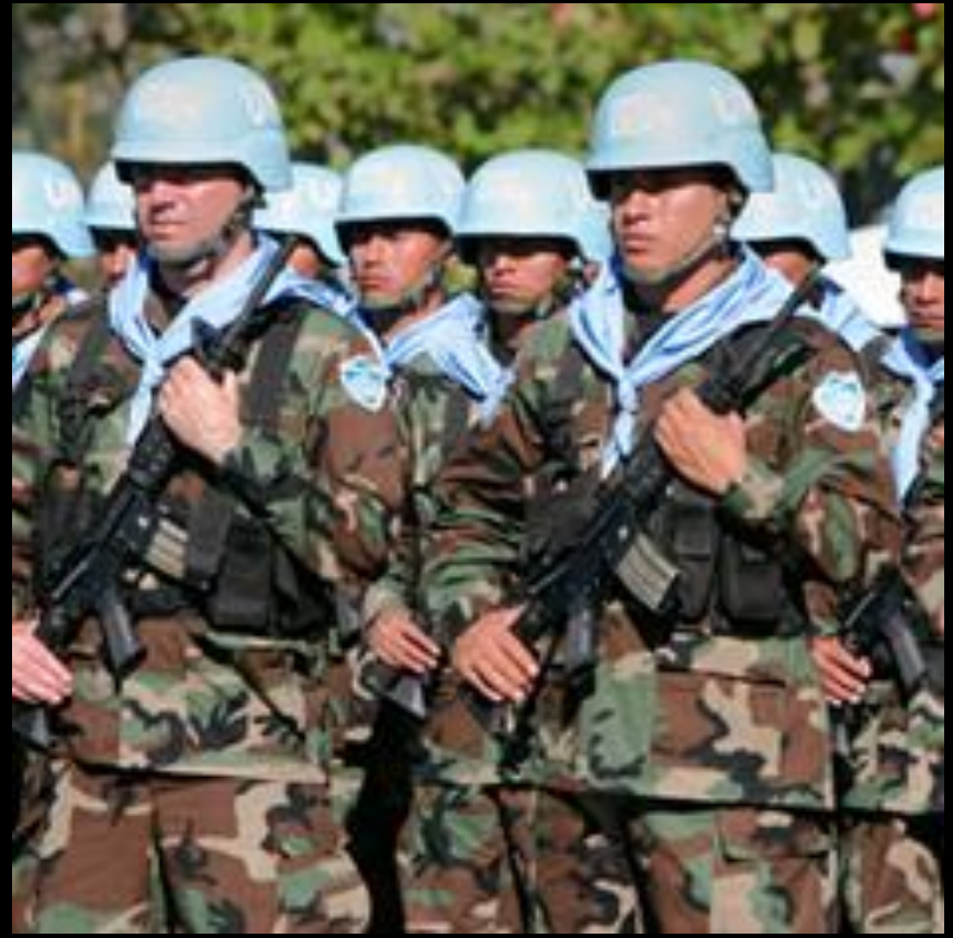
UN Peace Keeper 維和部隊