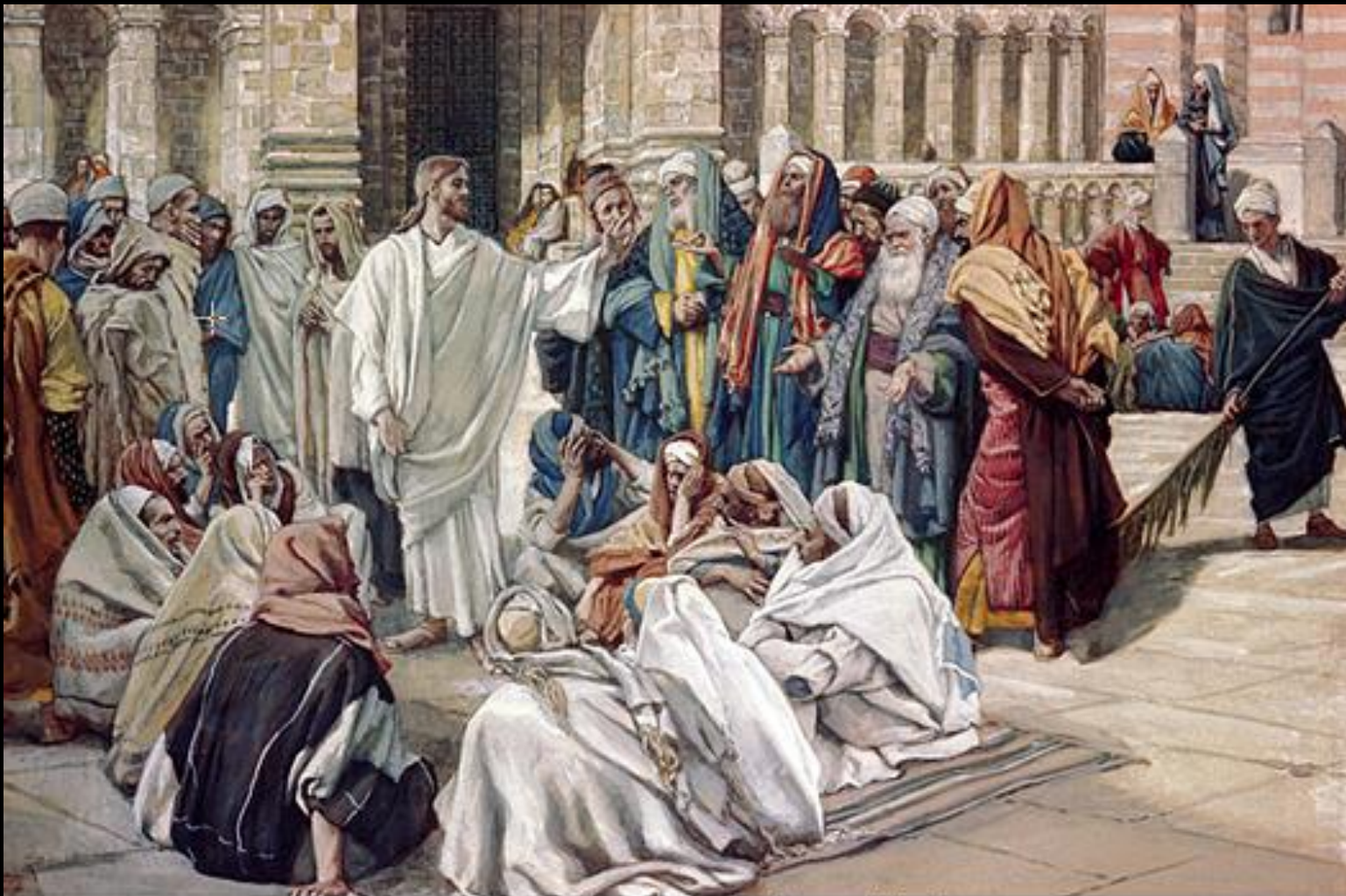
Pharisees Question Jesus by James Tissot

太 15:1-2 那時，有法利賽人和文士從耶路撒冷來見耶穌，說：“你的門徒為甚麼犯古人的遺傳呢？因為吃飯的時候，他們不洗手。”